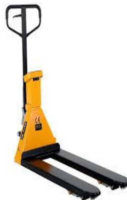
Tire palette (C)