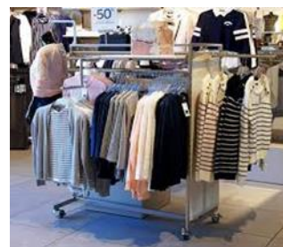
Portant de vêtements (N)