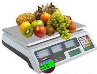
Pèse fruits et légumes (J)