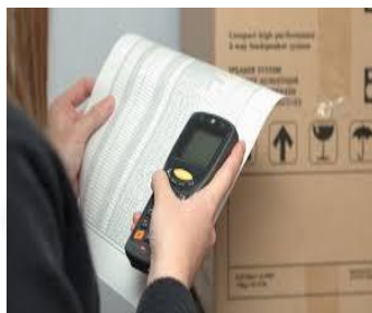
Lecteur Gencod (M)