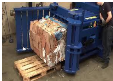
Compacteur de cartons (H)