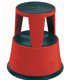
Marche pied (D)