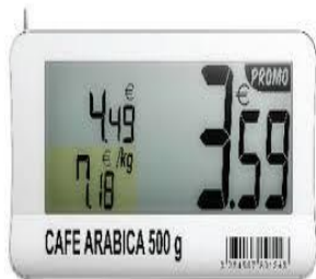
Etiquette électronique (L)